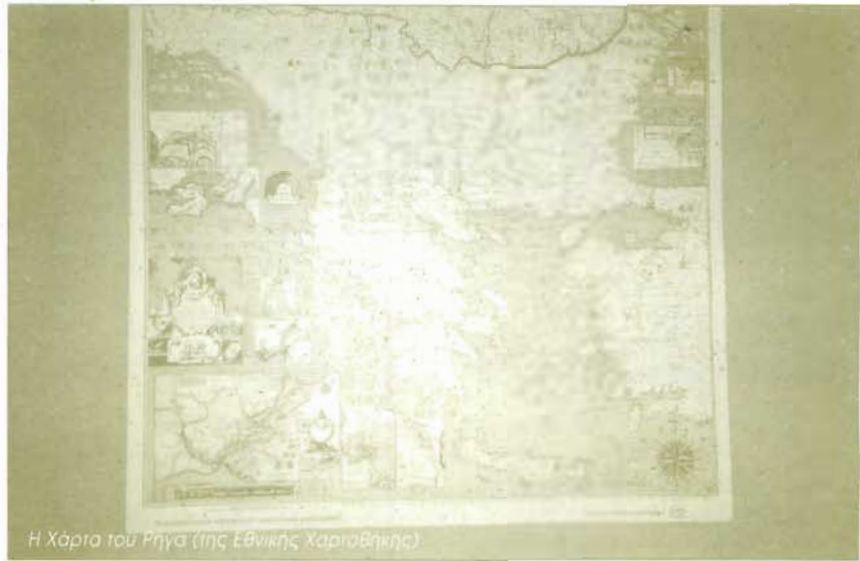
Η Χάρτα του Ρήγα (της Εθνικής Χαρτοθίκης)