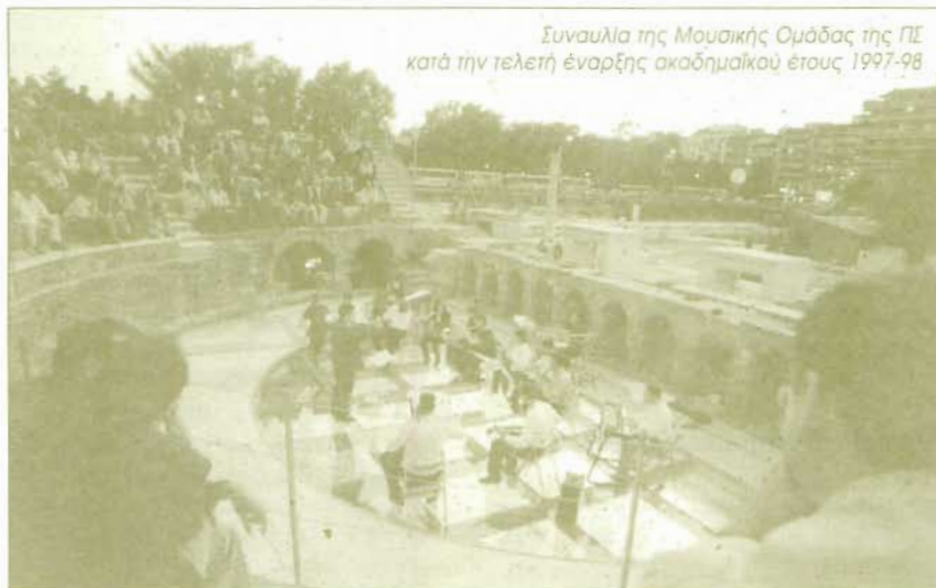
Συναυλία της Μουσικής Ομάδας της ΠΣ κατά την τελετή έναρξης ακαδημαϊκού έτους 1997-98

Το ΚΥΤ/ΠΣ ανέλαβε τη διαχείριση των servers ηλεκτρονικού ταχυδρομείου Vergina και Egnatia. Ο πρώτος χρησιμοποιείται από το προσωπικό και τους μεταπτυχιακούς φοιτητές, ενώ ο δεύτερος από τους προπτυχιακούς. Ο αριθμός των χρηστών του πρώτου