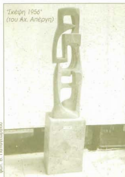
"Σκέψη 1956" (του Αχ. Απέργη)