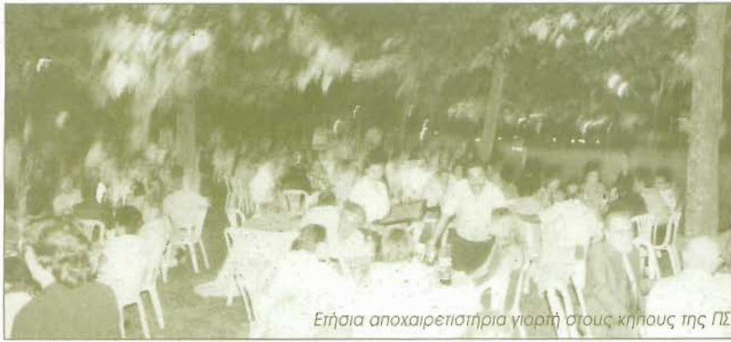
Ετήσια αποχαιρετιστήρια γιορτή στους κήπους της ΠΣ